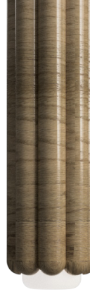
CN Cèdre naturel