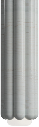
CB Cèdre blanc